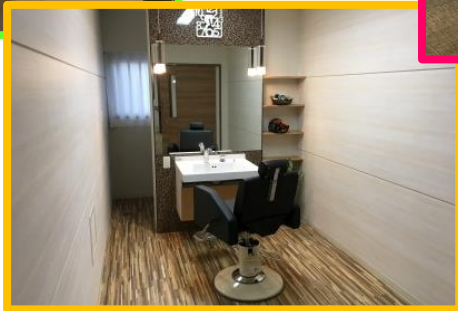
リフレッシュルーム