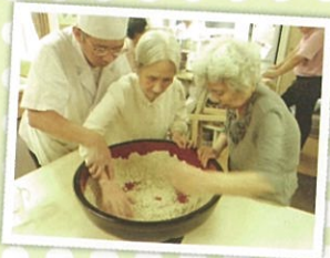
レクリエーションのご様子